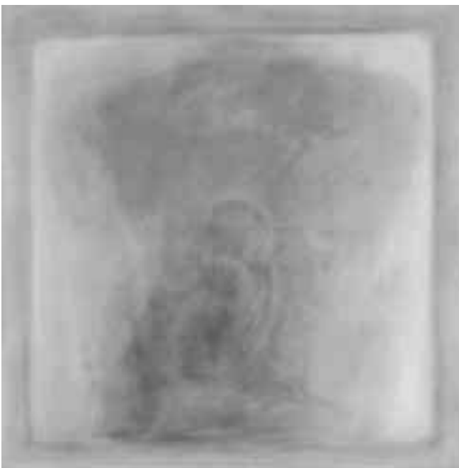
Ásztai Csaba: Apa gyermekével 2007. olaj, vászon, 100x100 cm

Az idén 60 éves ÁSZTAI CSABA festőművésznek ÚTON címmel nyílt kiállítása 2008. március 14-én a Szentendrei Szabadtéri Néprajzi Múzeum Skanzen Galériájában.